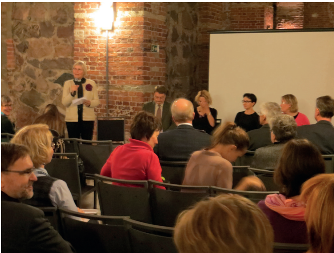
"Ihmisoikeudet ja kirkon kansainvälinen työ" -seminaari Helsingissä.

Kirkon lähetystyön keskus/KUO järjesti Ihmisoikeudet ja kirkon kansainvälinen työ -seminaarin Helsingissä marraskuussa. Seminaarissa käsiteltiin laajemmin niitä aiheita, joiden pe-